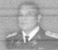
HERNÁN GIL BARRIOS GENERAL INSPECTOR TASS