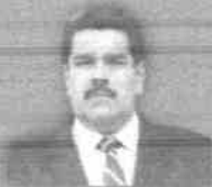
NICOLÁS MADURO PRESIDENT