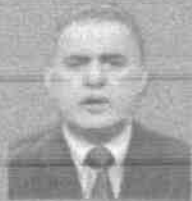
TAREK W. SAAB MINISTER OF ATTORNEY GENERAL