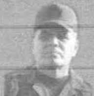
VLADIMIR PADRINO MINISTER OF DEFENSE