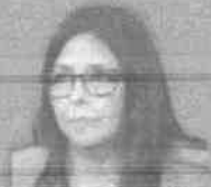
DELCY RODRÍGUEZ VCS - PRESIDENT